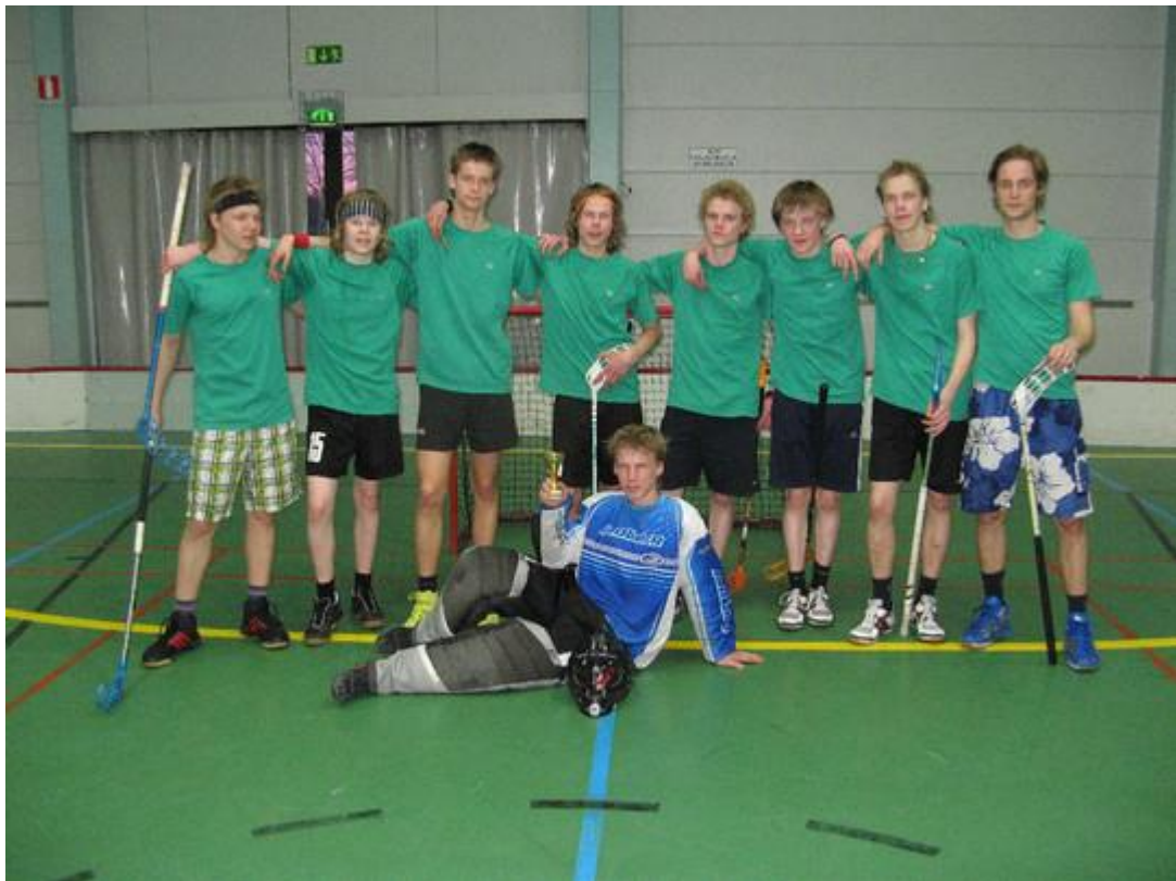
Pronssiottelun voitti Hoonarit.