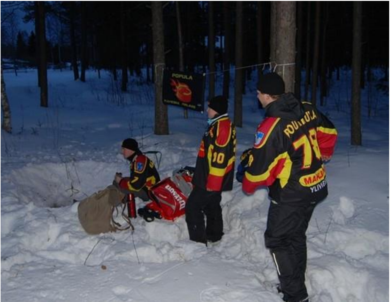
Huolto jaksoi odottaa hiihtäjiä...