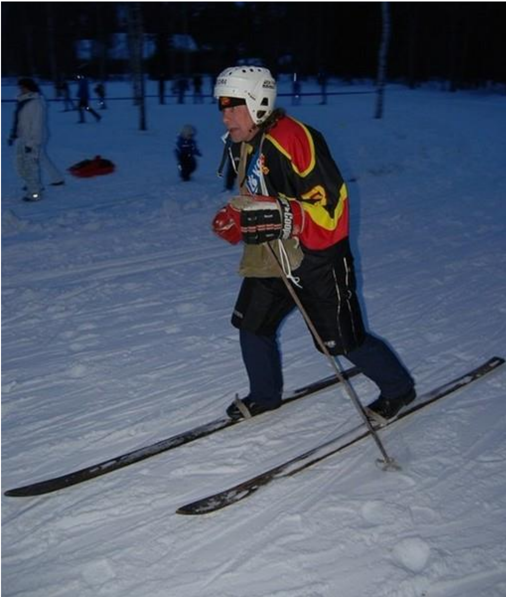
Ei tunnu missään...