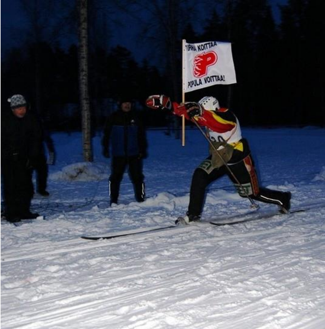
Ankkuri saapu maaliin...